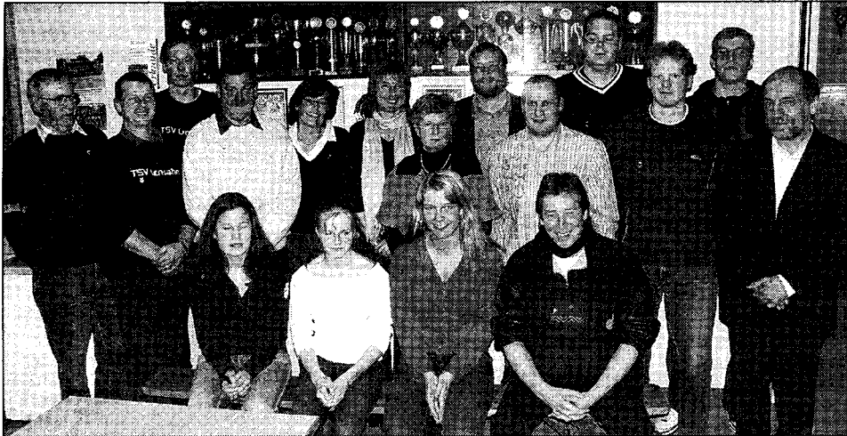
Die geehrten und ausgezeichneten Mitglieder im TSV Lensahn.

Lensahn. Schon die Sportlerehrung im Januar hat gezeigt, dass der TSV Lensahn mit seinen aktuell 958 Mitgliedern auf sportliche Erfolge bauen kann. Trotz einiger Wünsche seitens des Vorstandes und der Mitglieder, scheint die Welt doch in Ordnung zu sein. Zumal sich für eines der größten Probleme in den letzten Jahren endlich eine Lösung abzeichnet. Wie Bürgermeister Volker Bäuerle mitteilte, soll die Umwandlung des Grandplatzes in einen Kunstrasen 2007 abgeschlossen sein und die neue Anlage mit einem Eröffnungsspiel eingeweiht werden. Die Möglichkeit, neue Fördergelder anzuzapfen, hat den Bau bislang verzögert. Ein weiteres, leidiges Thema sind die knappen Hallenzeiten, mit denen insbesondere die Handballsparte zu kämpfen hat. Auch hier wird weiter nach Lösungen gesucht.